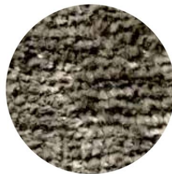
23 Sabbia Lunare