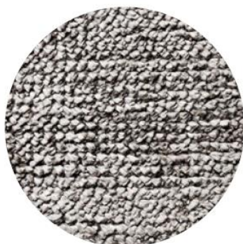
12 Argento Vero